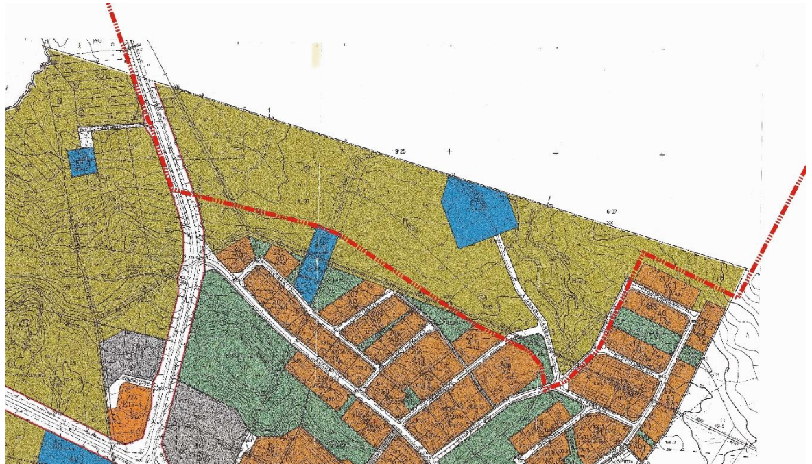
VOIMASSA OLEVA ASEMAKAAVA. MUUTOSALUEEN RAJAUS PUNAISILLA PISTEKATKOVIIVALLA