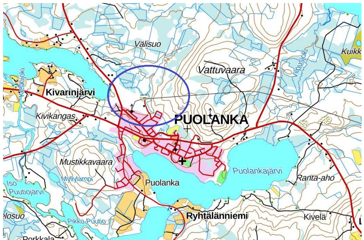
ALUEEN YLEISSIJAINTI. MUUTOS- JA LAAJENNUSALUE SINISEN YMPYRÄN SISÄLLÄ

Alueen yleissijainti, alustava alueen laajuus ja voimassa oleva kaava ovat oheisilla kartoilla.